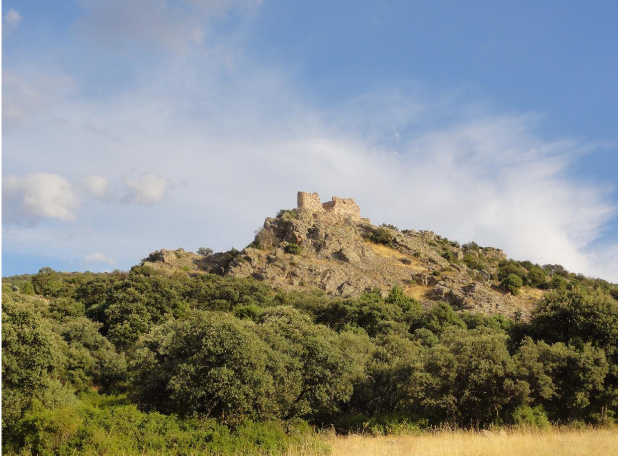
Imagen 3.- Vista del Castillo de los Baños de Cristo desde los pies de la fortificación