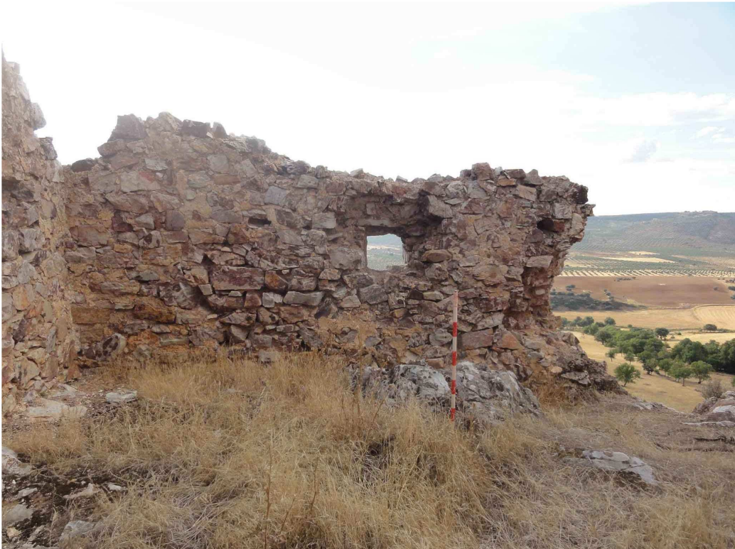
Imagen 5.- Detalle del interior de la fortaleza.