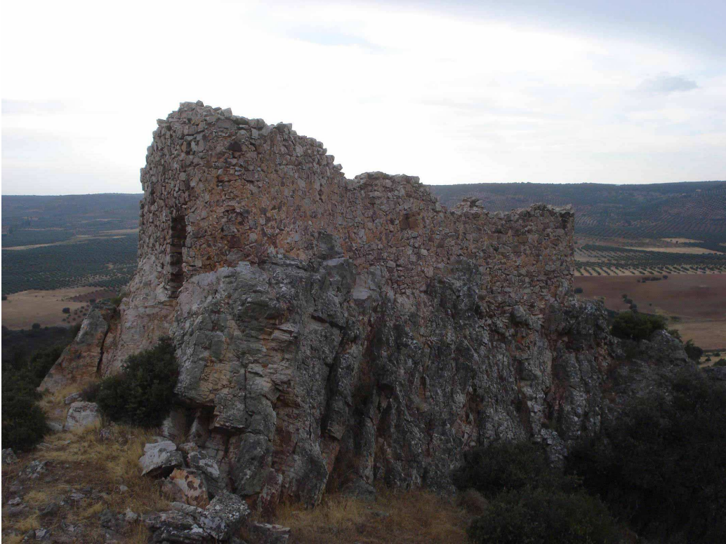
Imagen 4.-Detalle de paramentos exteriores de la fortaleza. Al fondo valle del río Villanueva.