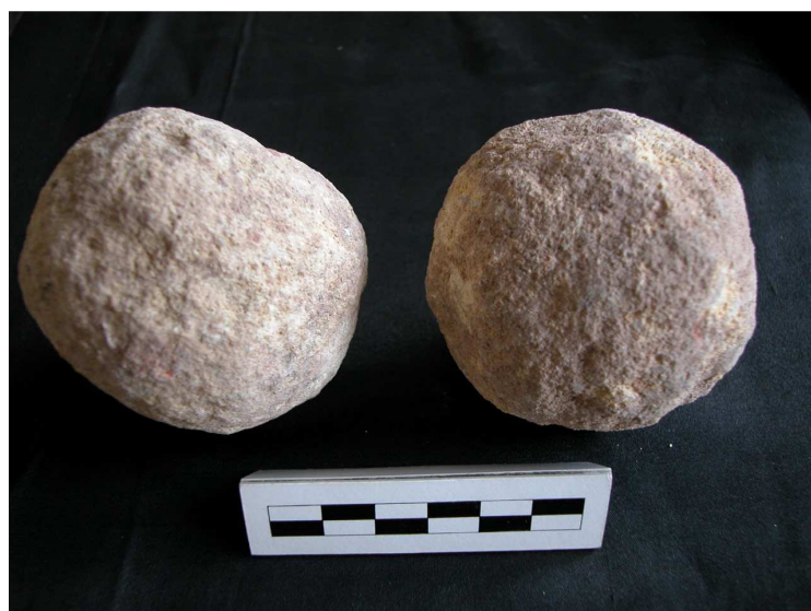
Imagen 2.- Boleños localizados en el entorno de Mentesa , Villanueva de la Fuente